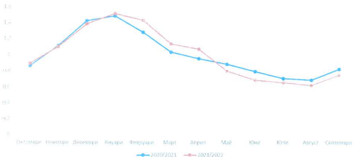
Приложими сезонни фактори за месечни, дневни и в рамките на деня капацитетни продукти за газови години 2020/2021 и 2021/2022

Изменението на приложимите сезонни фактори валидни за месечни дневни и в рамките на деня капацитетни продукти, както и изменението на приложимите сезонни фактори за тримесечни капацитетни продукти за двете газови години е показано на фигурите по долу.